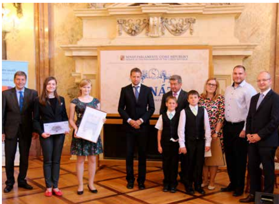
Snímek z vyhlášení výsledků druhého ročníku soutěže „Přeměna odpadů na zdroje“ v historickém sále Senátu, kde Burzovní nadace ocenila vítězné týmy ze základních a středních škol v kategorii Videoprojekty.

V podkategorii středních škol získaly nejvyšší ocenění studentky pražského Gymnázia Jaroslava Heyrovského za instruktážní video k výrobě výtvarných pomůcek. Na druhém místě se umístili studenti Střední průmyslové školy elektrotechniky a informatiky Ostrava a na místě třetím další tým studentek z Gymnázia Jaroslava Heyrovského.