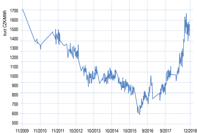
VÝVOJ KURZU ZP MO 1R SSD CZ (2010 - 2018)